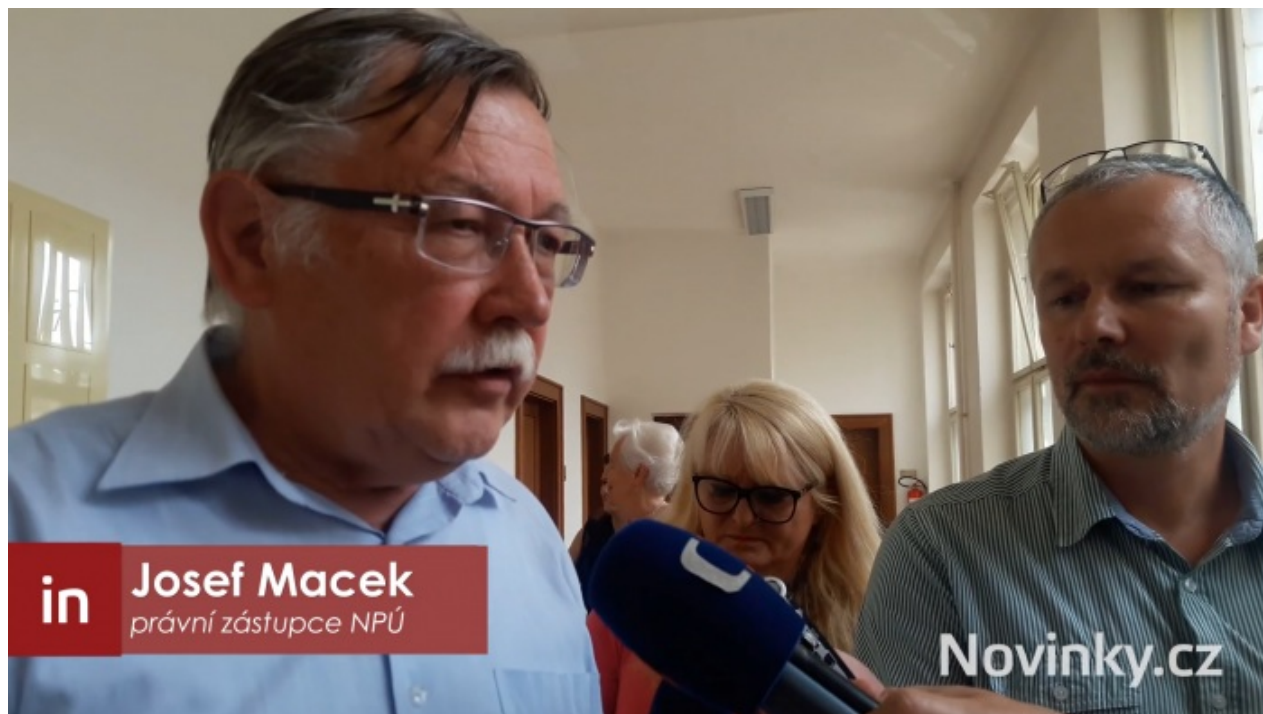
Zástupce Národního památkového úřadu oznamuje, že soud vůbec nevzal v úvahu jejich námítky.

prohlásí, že služba německého šlechtice v řadách Wehrmachtu a nacistické vojenské rozvědky Abwehrstelle není na překážku vrácení majetků, tak všichni politici a média v ČR mlčí.