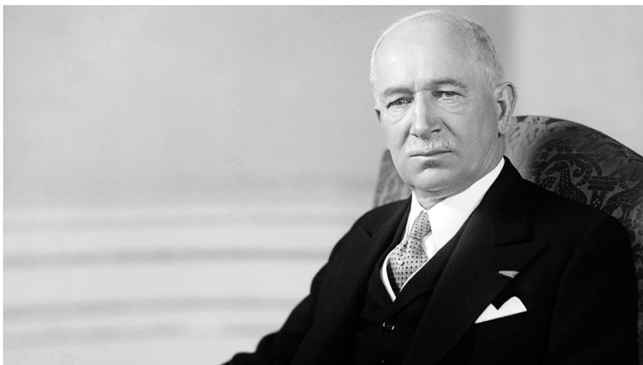
Edward Beneš se musí v hrobě otáčet. České soudy zradily vlastní národ a pošlapaly poválečné dekrety.

Napomoci tomu má i společná vojenská jednotka a velení, kdy české divizi z Žatce velí v NATO německý Bundeswehr. Informovali jsme o tom v článku zde . Přinesli jsme i sérii článků pod názvem "Německý orloj české politiky" [6], které ukazují hrozivé prorůstání sudetoněmeckých organizací do nejvyšší české politiky. A vidíte, že tato obrovská lobby po dlouhé době najednou přináší sudetským Němcům ovoce. Češi a jejich soudy dnešním dnem zahájili abolicí Benešových dekretů. Chtělo by se zvolat: "Češi, co jste to dopustili?" Nepřítel se vrací za pomoci zrádců v české politice a dokonce už i v justici.