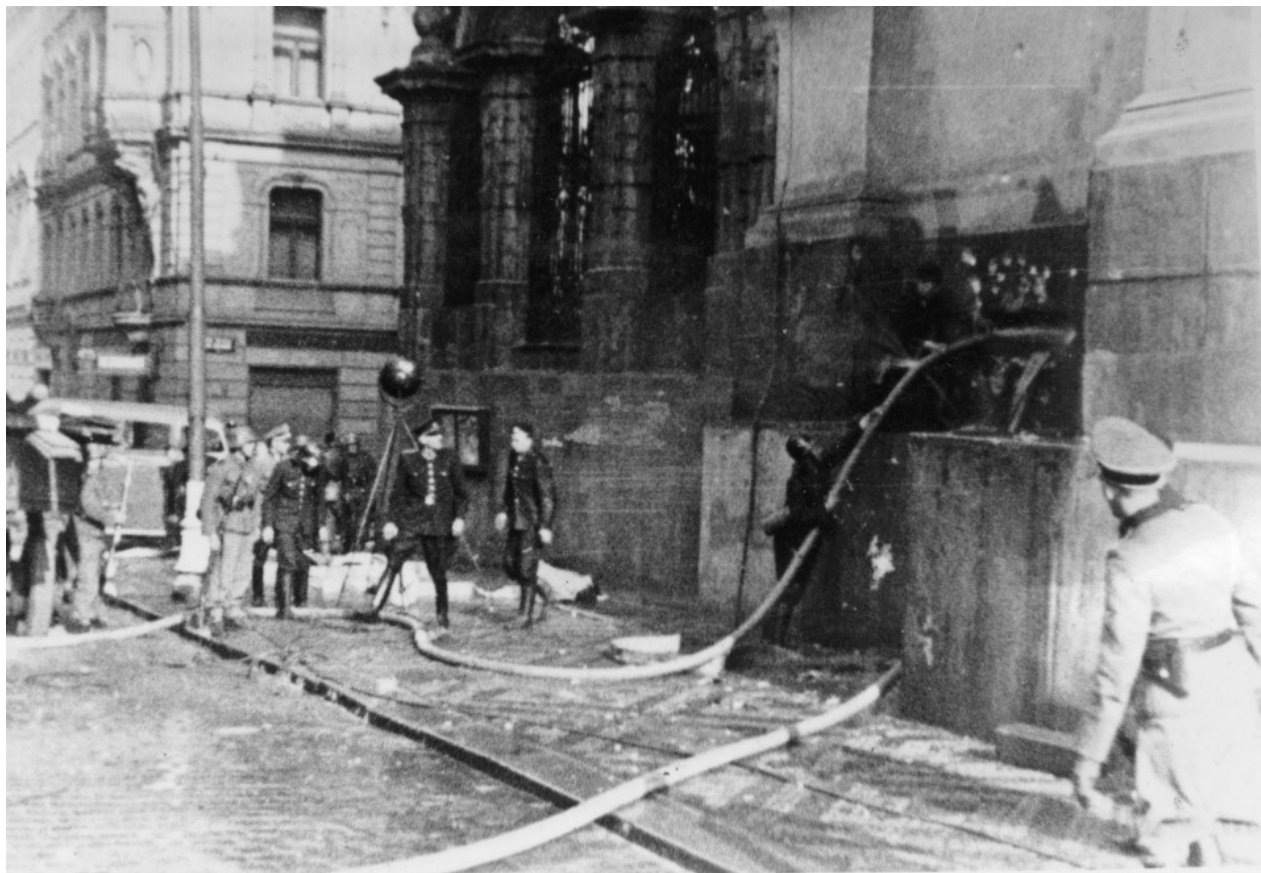
18. červen 1942 ráno: Nacisté napouští vodu do krypty kostela sv. Cyrila a Metoděje, aby vytopili ukřyté československé parašutisty.

tam ukřyvali v rámci operace Anthropoid poté, co provedli atentát na říšského zastupujícího protektora a generála policie Reinharda Heydricha. Zajímavý článek o kryptě v kostele najdete zde .