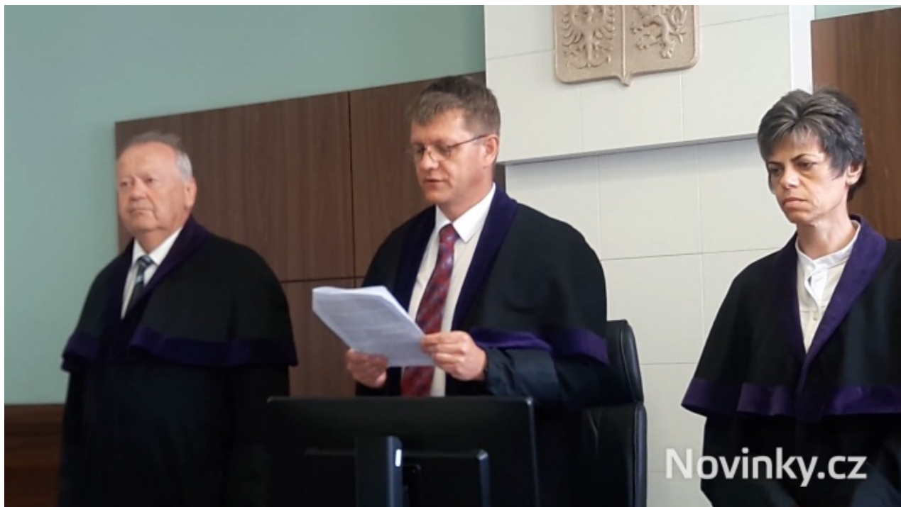
Vynesení rozsudku u soudu v Hradci Králové.