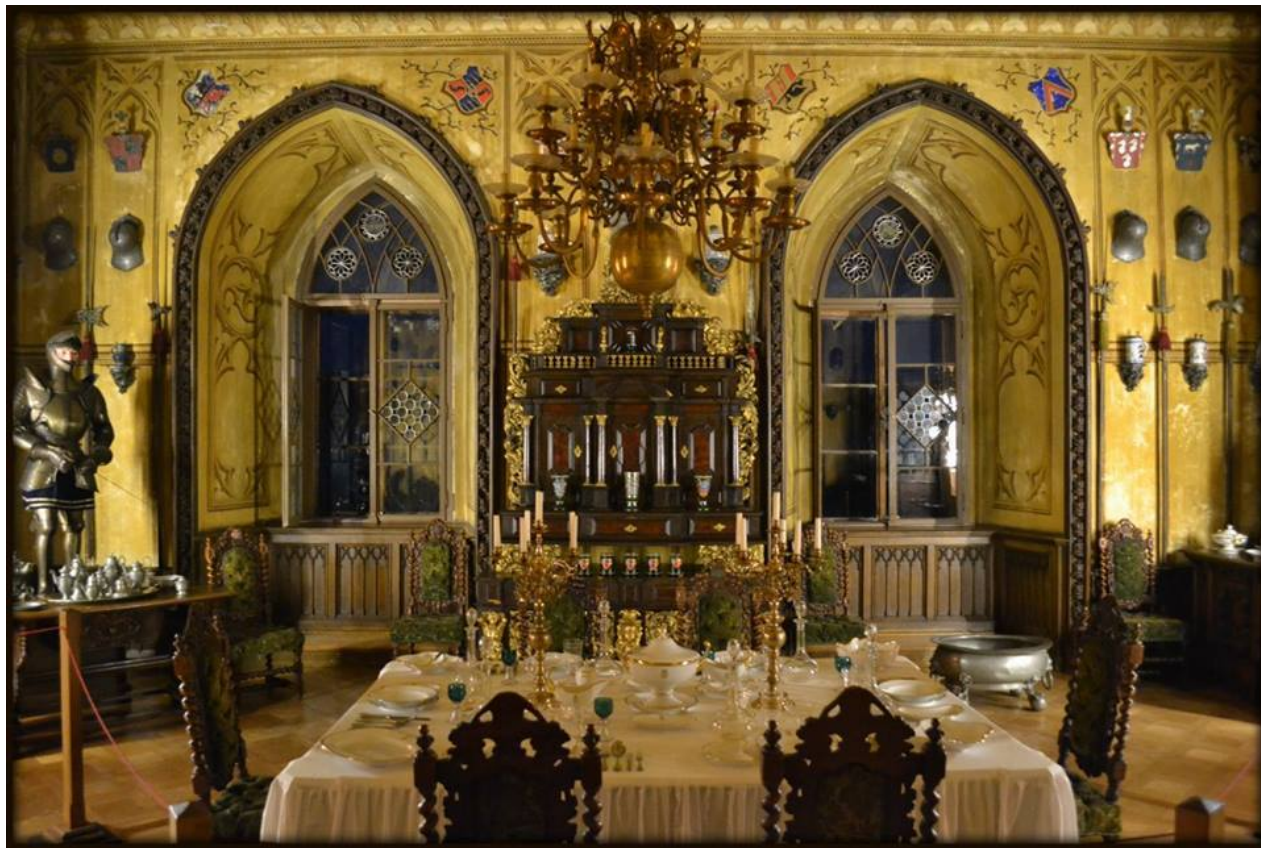
Interiér v zámku Hrubý Rohozec.